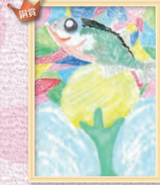
『ワクワク おおがき』 加納希彰さん(中川小3年)