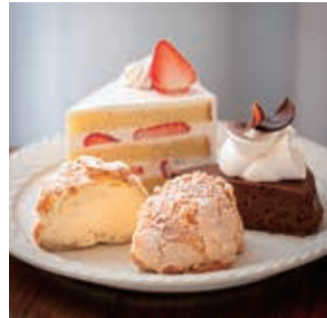
夏は桃に変わるショートケーキやシュークリームのほか、小麦粉を使わず低温でじっくり仕上げたガトーショコラも人気