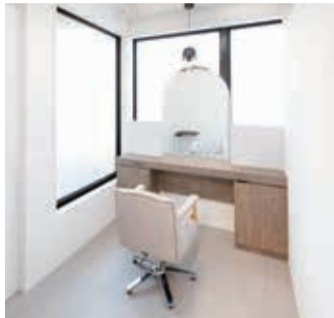
セット面は個室も合わせると6席あり、固定プランではインテリアや雑貨などを持ち込んで、自分好みに飾ることができる