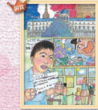
『ぼくの絵がパリの ルーヴル美術館にかざられたよ』 齋藤正晃さん(大垣東小5年)

※前回受賞作品につきましては、ご応募用紙をもとに掲載しております。タイトル・お名前の漢字・学年等には充分注意しておりますが、誤字・脱字はご了承ください。また、受賞者の学年は受賞当時のものです。