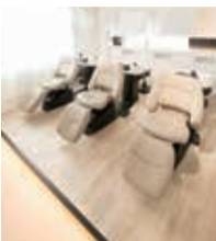
フルフラットで寝心地のいいシャンプー台は、ヘッドスパをメニューに加えることも可能

フリーランスの美容師やアイリスト、ネイリストが利用できるシェアサロンとして今年の1月にオープン。1日1席スポット貸しから個室固定の独占プランまでいろいろなプランがあり、自分のライフスタイルを大切にしたい働き方ができます。店内は白を基調とした落ち着いた空間で、幅広い年代のお客さまに対応できます。現在、フリーランス美容師3名、フリーランスアイリスト1名募集中です。