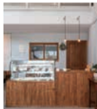
ケーキや焼き菓子などのテイクアウト専門で、お支払いは現金のみとなっている

ennoieミドリバシから移転オープンしたパイ。小麦粉の原種にあたる古代穀物のスペルト小麦を使ったお菓子など、ここでしか味わえないスイーツで人気のお店です。おすすめはスペルト小麦のスポンジと季節のくだものショートケーキ、きび砂糖でやさしい甘さのカスタードをザクッとした食感の生地で包んだシュークリームなど。夏には、グラスに入ったゼリーなどもショーケースに並びます。