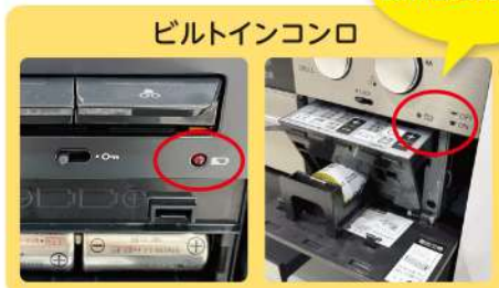
ビルトインコンロ