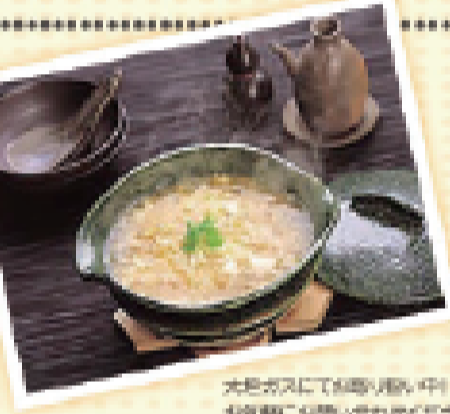
大抵ガスで調理する際、お鍋にお湯をいれお粥にしてください。