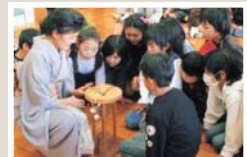
1300年の歴史がある組みひもの技術に興味深々購入する子どもたち

海外での活躍もさることながら、地域での活動にも意欲的だ。市内の小学校を訪問し、染織や組みひもを通して日本の伝統技術を継承している。「日本人が作るものは、機能的な上にとっても美しく、しかも戦争にはそういった技術がひときわ多い。それを子どもたちに伝えていけたらと思います」。そしてもう一つ、子どもたちに伝えたいのは「自然を大切にすること」。今はスッチを拝せば火が付き、蛇口をひねれば水が出る。それが当たり前で生活しています。ただそれらは全て大地と繋がっているんです。自然の恵みがなくて私達は生きられないということを忘れてはいけません。火も水も、大切に使うべきです」。