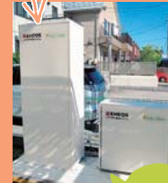
家庭用燃料電池「エネファーム」の特長は次号で!

イビケン(株)様のご協力のもと、「GREENY 岐阜」のエネファームを大垣ガスが設置いたしました。「GREENY 岐阜」はエネファームの他にも太陽光発電や小型風力発電など最先端の技術を盛り込み、使うエネルギーより創るエネルギーの方が多量です。これからは、わたしたち大垣ガスでも次世代の多様なエネルギーをミックスした「新しい暮らし」、皆様にも幅広く提案していきたいと考えております。