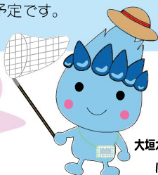
大垣ガスキャラクター ほのりん